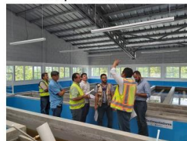
Recepción de Obra PTAP