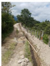
Excavación en Línea de Distribución Sector Las Palmas