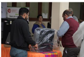
Entrega de equipo de computo