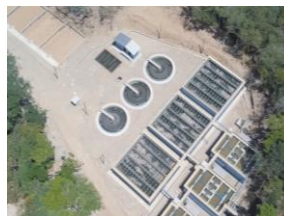
Panorámica de Filtro Percoladores y Sedimentadores PTAR