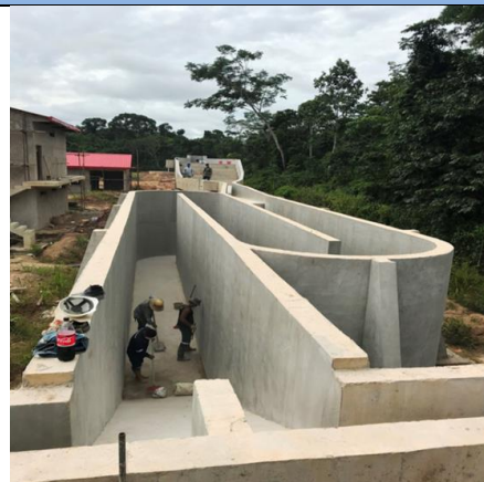
Fortografía 2. Sedimentador Cobija.