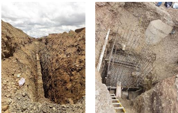
Fotografía 3. Seguimiento de la CAO (D8 El Alto).