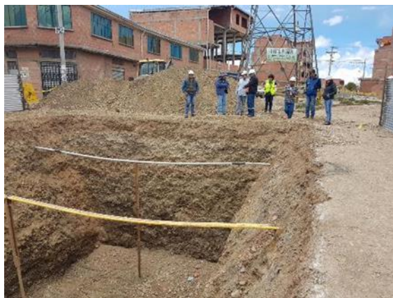
Fotografías 5,6 y 7. Alcantarillas profundas, cámaras de inspección profundas, paso de carretera camino Oruro.