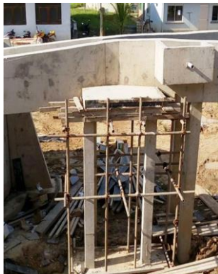
Fotografía 1. Floculador tipo vertical Cobija.